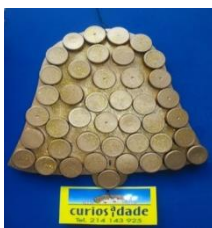
Concurso Enfeites de Natal