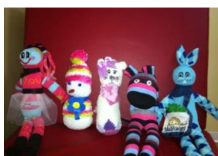
Atividade solidária IPO