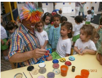
Aniversário da escola