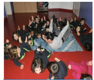
Atividades dos pais