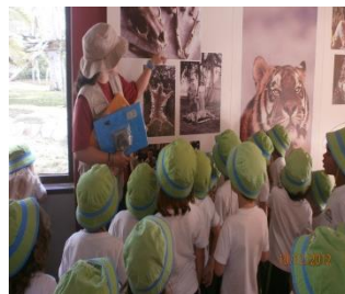
Visitas de estudo