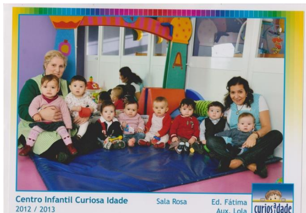
Centro Infantil Curiosa Idade 2012 / 2013

Há casos de bebês que se sentam com 5 meses, enquanto outros só vão fazer isso aos 8. Essa diferença é normal e dá-se por causa dos diferentes ritmos biológicos. Daí que hoje, considera-se melhor pensar nas competências individuais e não na idade.