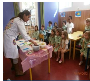
Semana da alimentação